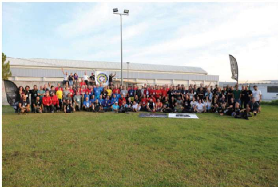
Figura 1 - Fotografia de grupo